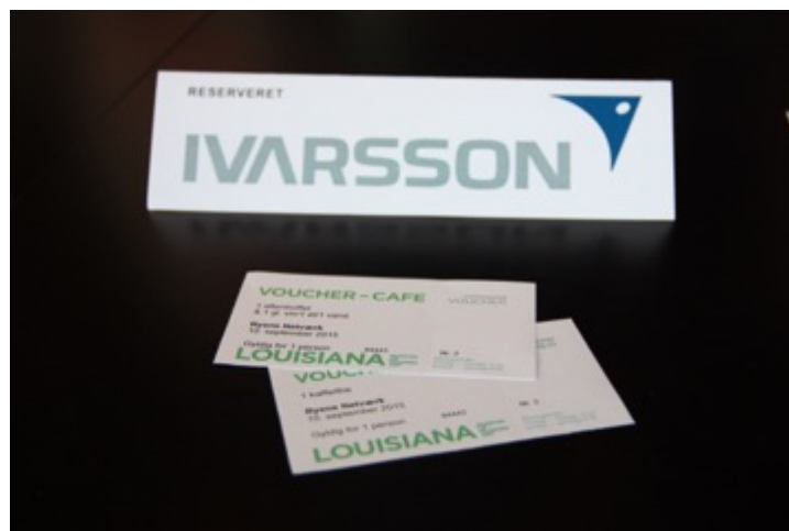
Vi netværker i Louisianas café.