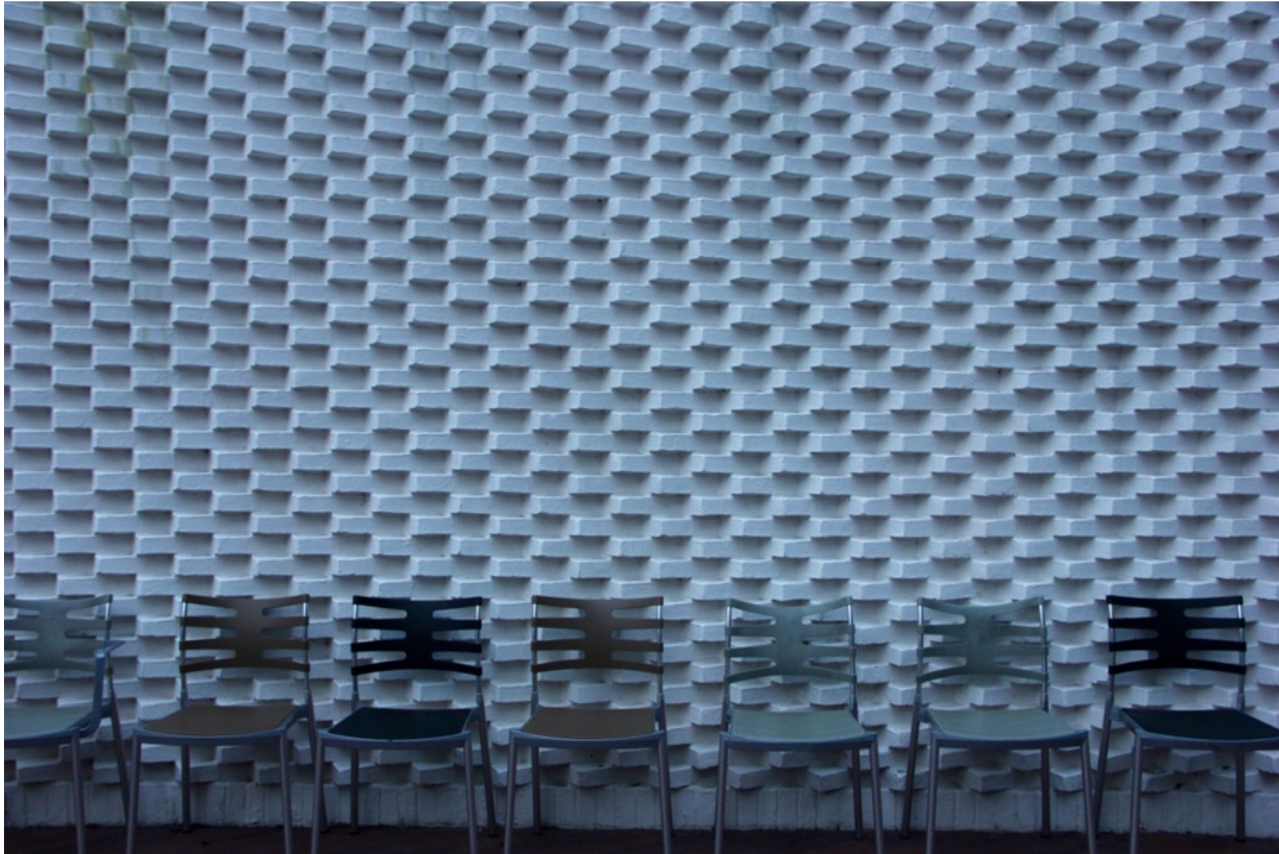
Tomme stole uden for cafeen.